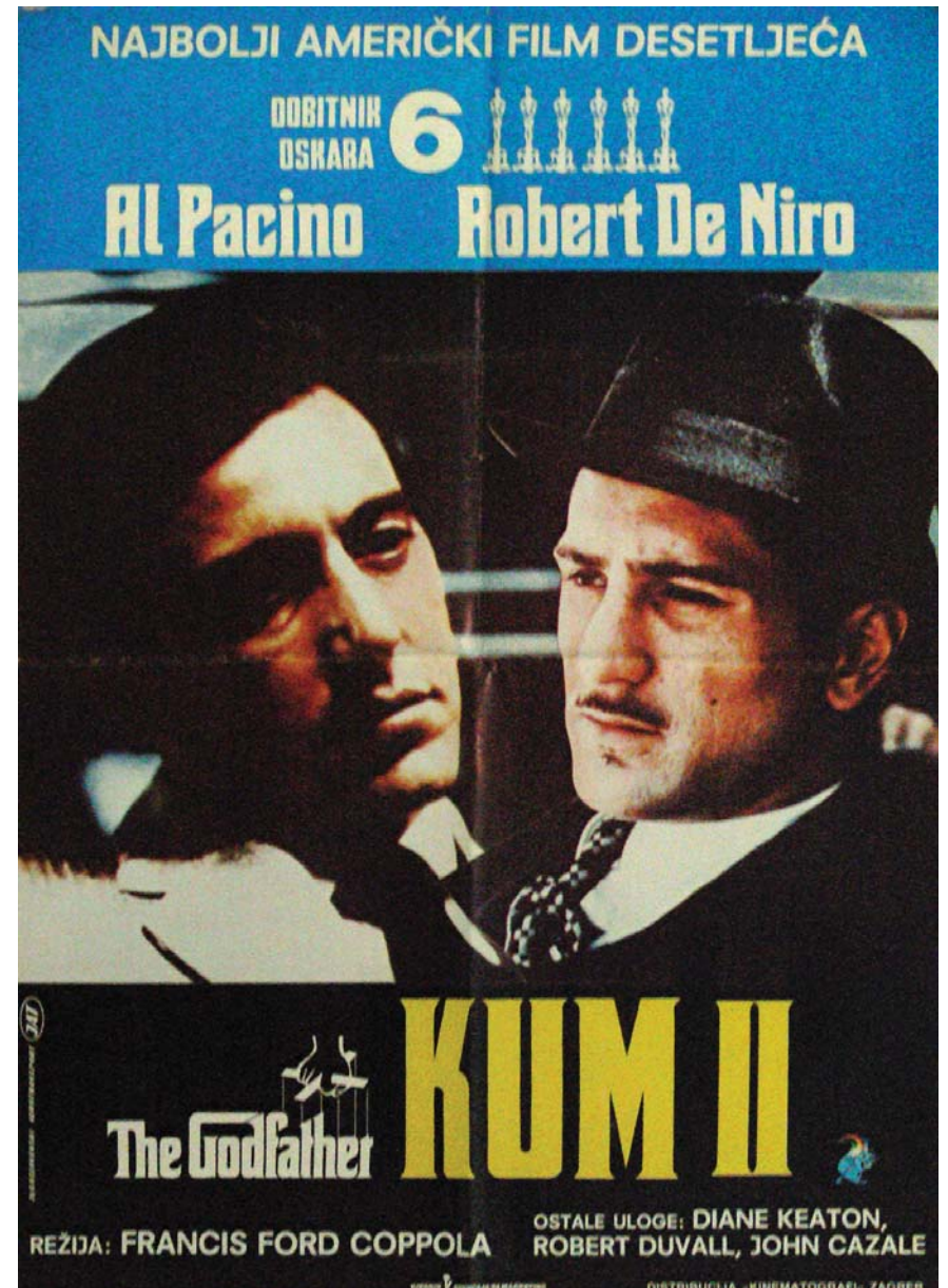
Кум II (The Godfather. Part II)