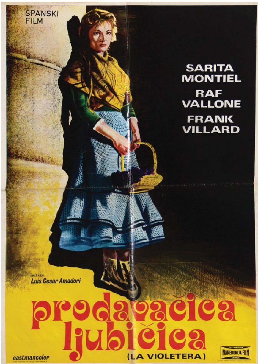
Продавачица љубичица (La violetera)